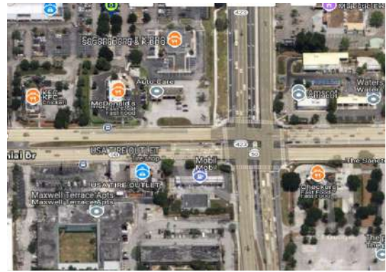
Рисунок 1. Перекресток W Colonial Dr и магистраль 423 во Флориде

На заключительном этапе в идентичных условиях моделирования была проведена оценка эффективности работы систем с фиксированным временем и интеллектуальных светофоров.