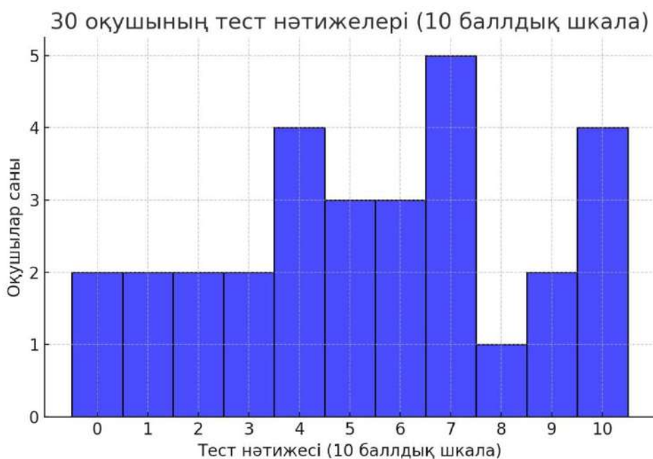
Сурет 1. ЖИ арқылы оқушылардың білім деңгейін анықтау диаграммасы.

Нейрондықжелілердіқолданунәтижесіндеәроқушыныңәлсізтұстарынаықтайтынжекемо дельдержасалды.