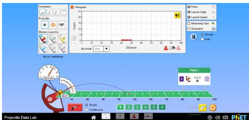
1 - Сурет PhET симуляторы