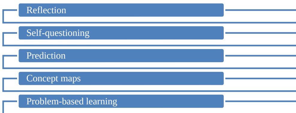
Figure 1. Methods and techniques for developing metacognitive skills in physics lessons.

Next, let's move on to the methods and techniques for developing metacognitive skills in physics lessons: