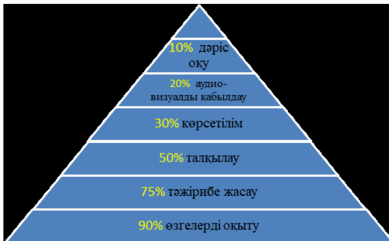
Сурет 1 – Оқу пирамидасы [1].

Мұғалім оқушыларды оқытқанда білім ортасын құруы керек. Ол білім ортасы оқушыларға қалай оқу керек екенін үйренетіндей орта болуы қажет. Сондықтан біз сабақты жоспарлаған кездегі алатын тәсілдеріміз, тапсырмаларымыз, бағалау тәсілдері барлығы оқушыларды қалай оқу керек екенін үйренетуге ықпал жасауы керек. [1] Ол мұғалімнің біліктілігіне байланысты. Зерттеу нәтижелері бойынша оқушылар алған ақпараттың қанша пайызын есте сақтайтыны 1-суретте көрсетілген. Нәтижелерге сәйкес алынған ақпаратты есте сақтаудың ең тиімді тәсілі «Өзгелерді оқыту» болып табылады. Сондықтан мұғалім сабақ жоспарын жасағанда балалар бір-бірін оқытатын, болжау жасайтын, көмектесетін жағдайларды қарастыруы және оқушылар тапсырманы орындағанда тиімді тәсілдерді қарастыратын, аргументтерді жасайтын, дәлелдемені дәлелдейтін танымдық орта құруы керек.