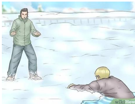
Сурет 3 – Мұз жарылып суға түсіп кеткен бала мен оның ағасы [3].

3-суретте мұз жарылып суға түсіп кеткен бала мен оның ағасы бейнеленген. Ағасының жанында адамды құтқаруға көмектесетін ешқандай құрал жоқ. Бірақ ағасы қиын жағдайда қалған інісін құтқаруға бел байлады. Сіз осы жағдайда болғаныңызда баланы қалай құтқарушы едіңіз? Өз жауабыңызды физикалық тұрғыдан түсіндіріңіз.