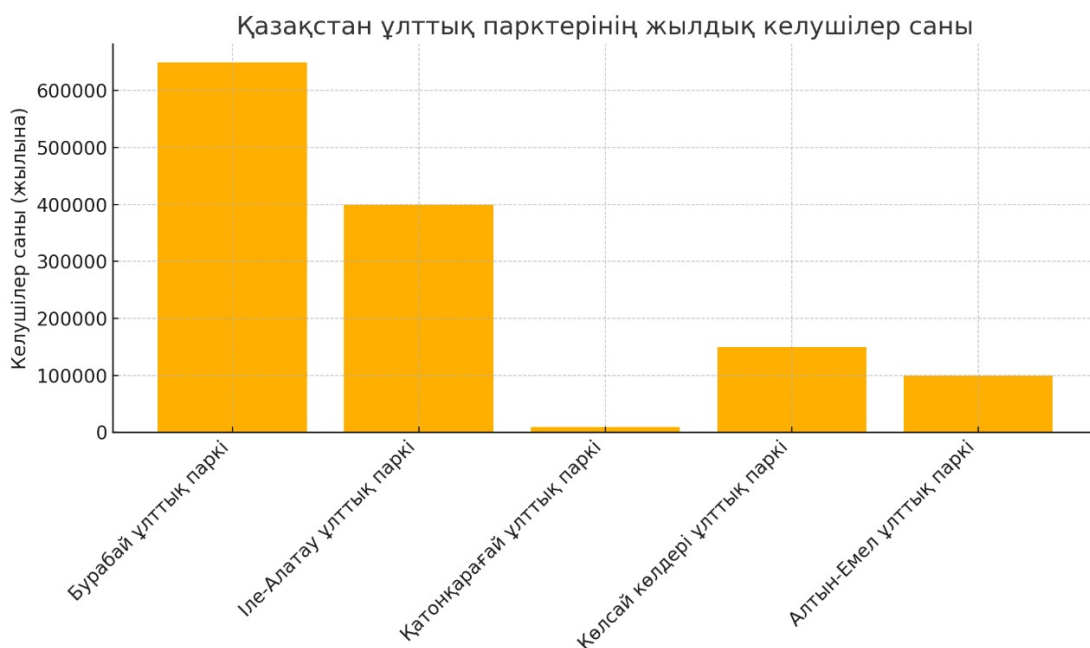
2-сурет. Қазақстан ұлттық парктерінің жылдық келушілер саны * stat.gov.kz/region/akimola/ негізінде автормен құрастырған

1-суретте көрсетілгендей, ұлттық парктердің сапалық көрсеткіштер бойынша жиынтық бағасын көрсетеді. Бұл көрсеткіштерге инфрақұрылымның жағдайы, табиғи ресурстардың сақталуы, экологиялық білім беру мен туризмге бейімделу деңгейі кіреді. Бұл тұрғыда Іле-Алатау (24 балл), Қатонқарағай (19 балл) және Бурабай (19 балл) ұлттық парктері алдыңғы қатардан көрінеді.