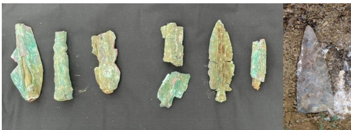
4-сурет. Солдан оңға қарай: 1-4 – төлкелі жебе ұштары; 5 – сапты жебе ұшы; 6 – төлкелі жебе ұшы; 7 – тас жебе