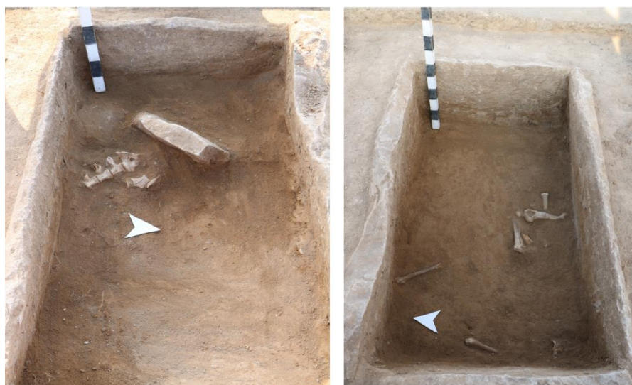
3-сурет. Тас жәшіктің ішіндегі жылқы қаңқасының бөлшектері (сол жақта ракурс шығыс қабырғадан; оң жақта ракурс батыс қабырғадан)