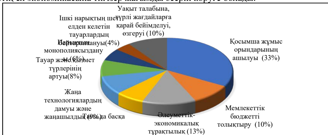
Сурет - 1. Шағын және орта бизнестің ел экономикасына әсері

Шағын және орта бизнесті дамыту - кез келген ел экономикасының негізі. Кәсіпкерлік қоғамның әлеуметтік жағдайын дамытып, сол арқылы экономиканы дамыта алады. Демек, кәсіпкерлік экономиканың қозғаушы күші деп айтуға болады. Шағын және орта кәсіпорындардың санын дамыған елдердегі ЖІӨ деңгейімен салыстыру, шағын кәсіпкерліктің экономикадағы маңызды рөлінің айқын дәлелі болып табылады [1]. БҰҰ мәліметтері бойынша әлем халқының жартысы шағын бизнеспен айналысады. Бұл ретте айтарлықтай үлес дамыған мемлекеттерге тиесілі екені түсінікті. 1-суретте шағын және орта бизнестің ел экономикасына тигізер жағымды әсерін көруге болады.