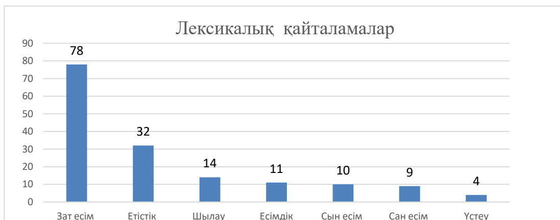
Сурет 1. Лексикалық қайталамалардың сандық талдауы Дұрыстау!

«Ер Жәнібек» жырындағы лексикалық қайталамалардың морфологиялық сипатына келсек, жырда зат есім,сын есім, сан есім, есімдік, етістік, үстеу және шылау сөздерден жасалған лексикалық қайталамалар бар. Олардың ішінде жиі қолданылатыны зат есімдер (78) мен етістіктер (32), одан кейін шылау (14), есімдік (11), сын есім (10), сан есім (9) және үстеу сөздер (4) (1-сурет)