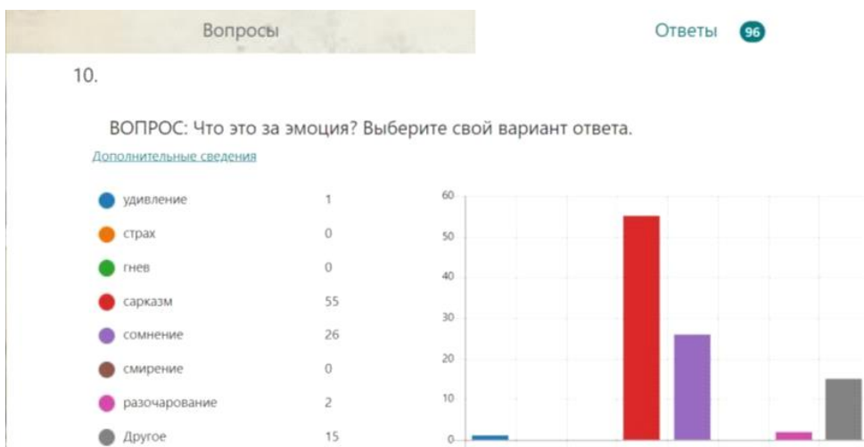
Рис. 2. Результаты 10 вопроса

Большее количество (55) выбрало – «сарказм», ведь на это указывает полуухмылка. 26 людей выбрало сомнение, возможно на это указывают брови, которые чуть ближе к середине лица и полуухмылка. И 15 респондентов решили дать свои варианты интерпретации. Среди которых: “дерзость”, “самоуверенность”, “Адольф Аласович”, “Хай Гитлер”, кто-то даже пошутил “смайлик, выражающий желание напасть на Польшу”. Варианты “дерзость” и “самоуверенность” вполне логичны, так как на смайлике, в отличие от предыдущего, есть причёска и именно эта причёска воспринялась ответившим как признак “крутости” (стереотип, навязанный западной культурой фильмов и сериалов). Но вот, что касается ответа “Гитлер”, то тут очень хорошо у студента срабатывает ассоциативная реакция, которая тоже так или иначе связана с рефлексией. На Гитлера для него указывают известные усы и причёска “зачёсанная на один бок” и нельзя не добавить злую ухмылку, ведь как известно отличился он не добрыми намерениями на людей. Кстати, этот вид эмодзи по определению Е. А. Антоновой, относится к клиповой культуре подачи информации, то есть подачи информации через смайлики, утверждая, что смайлики могут заменять некоторые части речи или даже предложения [4].