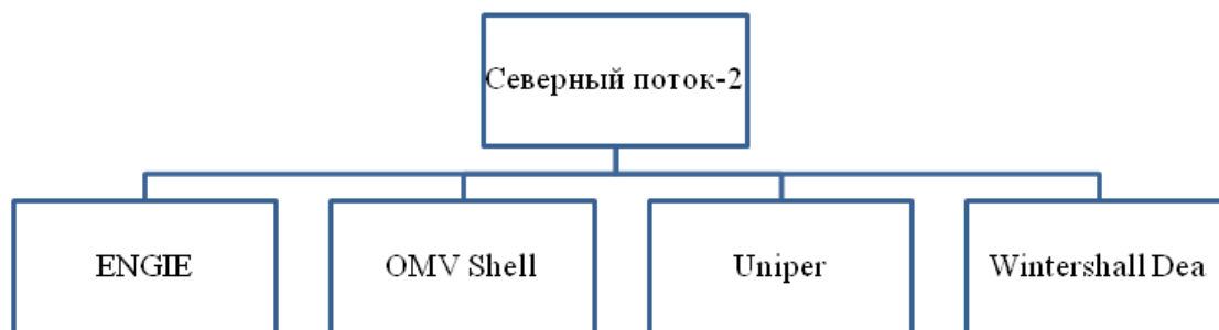
Рисунок 3. Источники финансирования Северного потока-2

Знаковым шагом стало урегулирование сорокалетнего датско-польского конфликта