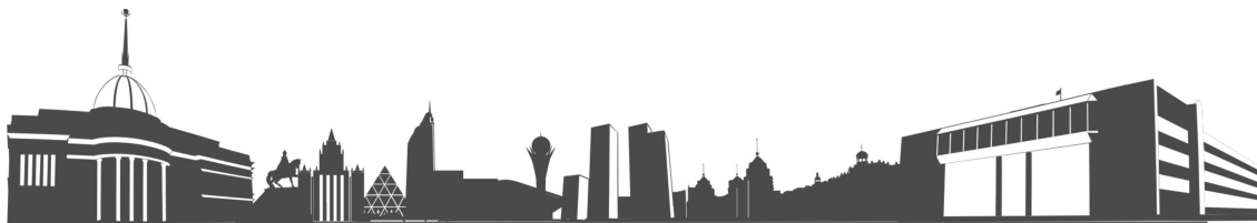
FIGURE 1 – Название рисунка