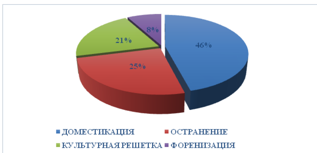
Диаграмма 2. Переводческие стратегии А. Байтурсинова. «Сказка о золотом петушке»

Диаграмма отражает направленность Байтурсинова-переводчика на доместикацию (46 %) как адаптацию сказки Пушкина к восприятию читателя посредством образов, понятий и языка родной культуры. Диаграмма также показывает приоритетность остранения (25 %) – как расширения доместикации – посредством влияния национальной концептосферы на авторскую. Культурная решетка (21 %) отражает более широкое, в сравнении с переводом Жиенбаева, привлечение приемов формульной поэтики, в том числе русской народной сказки и сказки Пушкина. Форенизация (8 %) объясняется сохранением звуко-символизма: