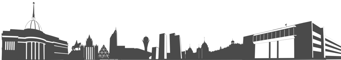
Рисунок 3 – Название рисунка