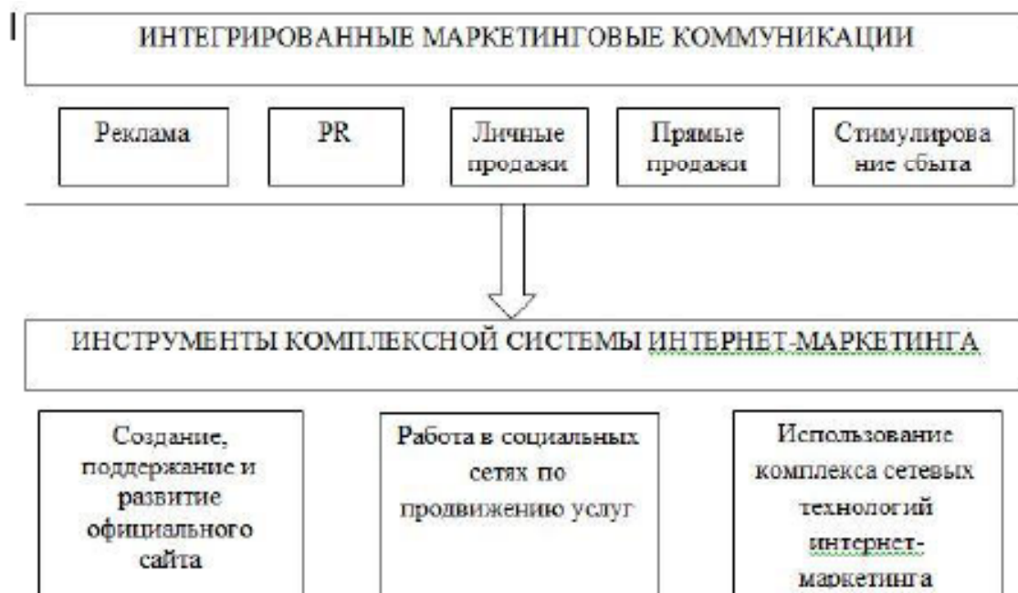
Рисунок 3. Основные ключевые направления развития КСИМ в процессе управления ИМК гостиничного предприятия

В этом случае можно говорить о трех основных ключевых направлениях развития КСИМ в процессе управления ИМК гостиничного предприятия (рисунок 3).