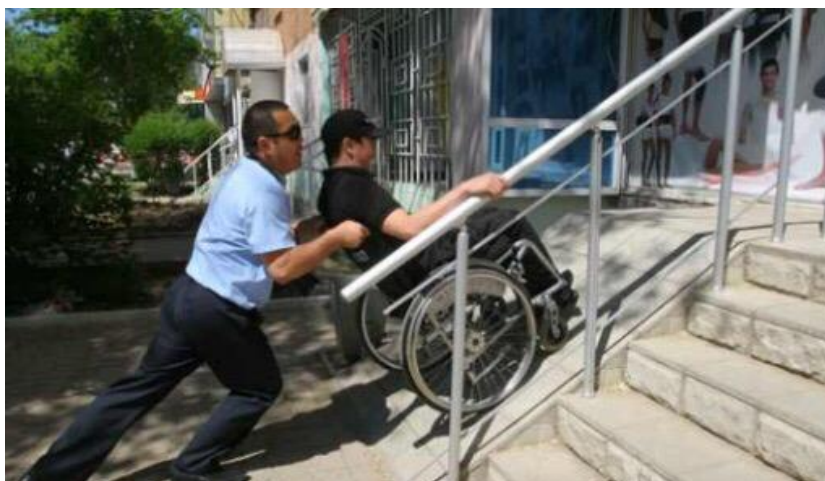
Сурет 3. Мемлекетіміздегі тұрғын үйлерінің бірінде

Кез келген адам өзіне деген мүсіркеушілік пен шарасыздықты сезінгісі келмейді, сол себептен қаланың, ғимараттардың, интерьердің жетерліктей ыңғайлы болуы қажет. Басты мақсаты мүмкіндігі шектеулі адамдардың мүмкіндігін арттыру болып табылады. Яғни күнделікті өмірде қоғамда өз орын алу дені сау адамдарға да қиындық соқтырады, ал мүгедек адамдар үшін бұл алынбас асудай болып көрінуі мүмкін, сол себептен қоршаған орта, ғимараттар мейірімдірек болуы үшін жаңа сәулеттік бөлшектер немесе сәулеттік ғимараттарды қосу арқылы ыңғайлы ортаны жобалау басты мақсат болып табылады[1].