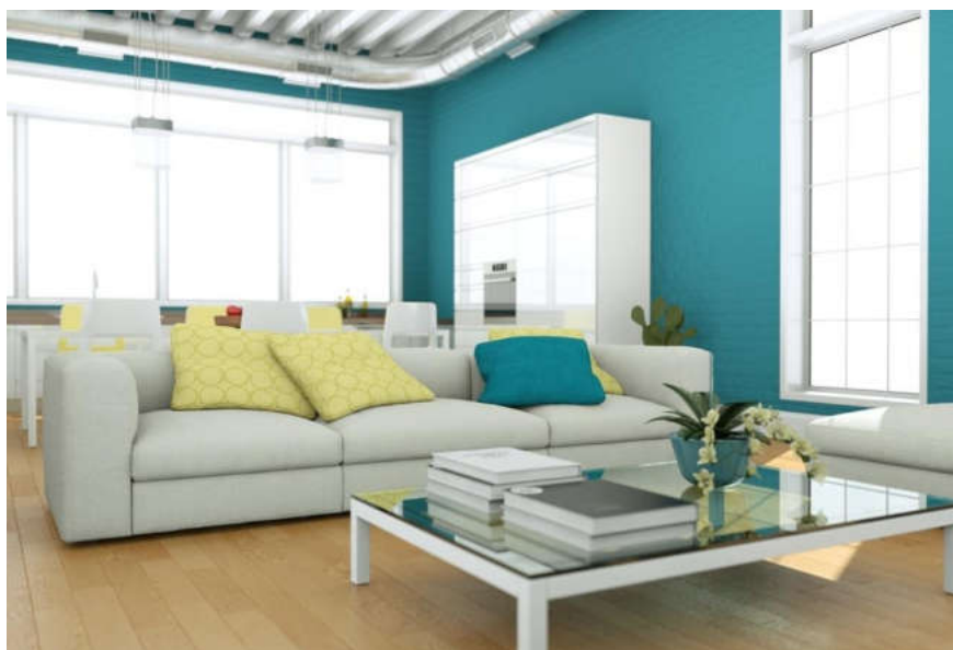
Сурет 4. Суық түсті тонға бөленген қонақ бөлме.

Тұрғын үй және қоғамдық ғимараттардың ішкі және сыртқы түріндегі түс көбінесе суретшінің субъективті көзқарасына байланысты болса, онда өндірістік ғимараттардың интерьерінде түс осы ғимараттардың және олардың элементтерінің мақсатына, бағдарына, жылудың сипатына байланысты алдын ала анықталады. Сондықтан өнеркәсіптік ғимараттар үшін түсті реттеу әзірленді.