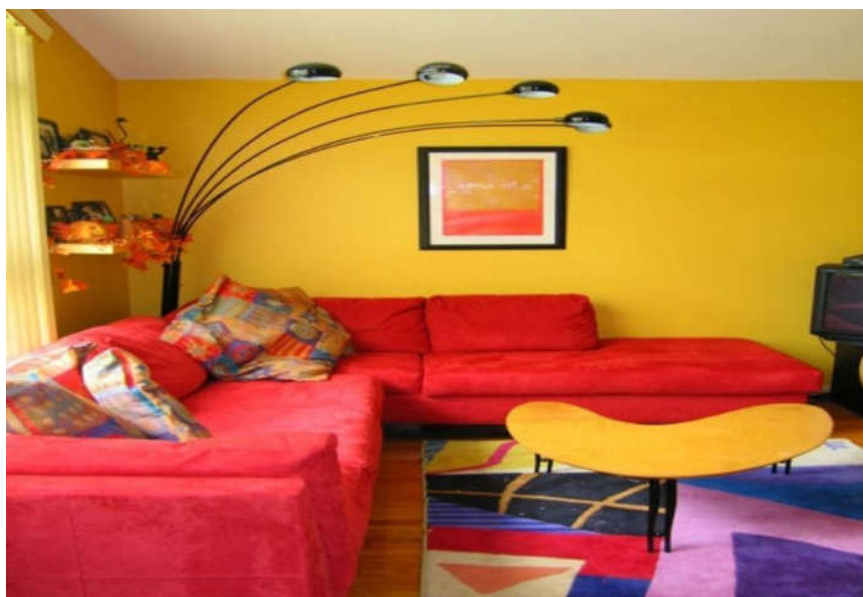
Сурет 3. Жылы түсті балалар бөлмесі.

Табиғи күндізгі жарық түспейтін бөлмелерде жылы немесе бейтарап-жылы түстермен бояу ұсынылады. Суық түсте оңтүстікке немесе оңтүстік-батысқа, орталық аймақтарға бағытталған бөлмелер, сондай-ақ жоғары жылу бөлетін бөлмелер болуы мүмкін.