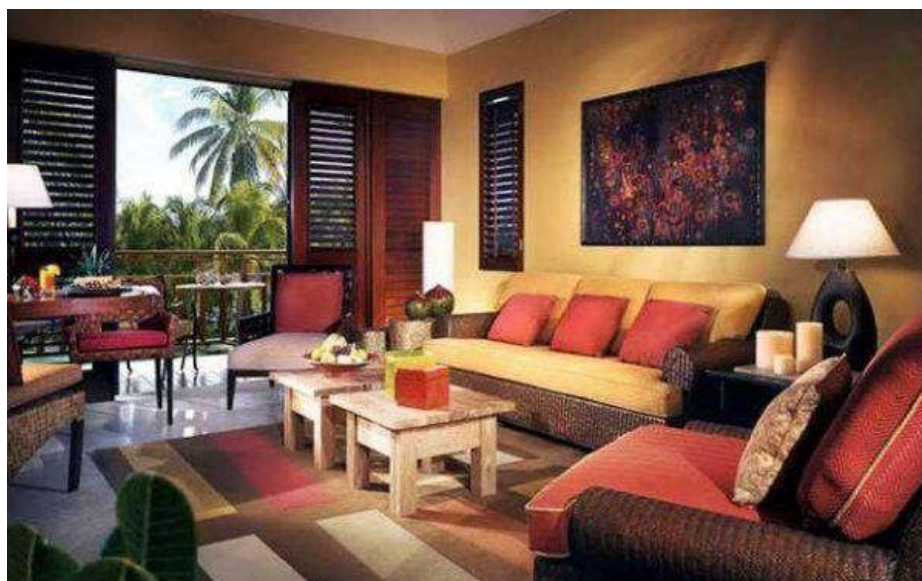
Сурет 2. Көңілді кештер үшін жасалған қонақбөлме.

Үйдің микроклиматын ыңғайлы ету үшін тұрғын үйді ұйымдастыру кезінде әрлеу түстерін біріктіруді білу керек. Мұны әртүрлі жолдармен жасауға болады. Контрасттарда ойнау ,бір кеңістікте әртүрлі температура түстерін біріктіруді қажет етеді. Фон үшін бұл жағдайда дизайнның түс схемасын құрайтын реңктердің ең жарқынын алу ұсынылады. Қалған түстерге қосымша рөл беріледі.