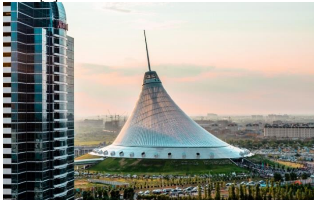
6 рисунок. Хан Шатыр.

Здание представляет собой гигантский шатер высотой 150 м (шпиль), сконструированный из сети стальных вант, на которых закреплено прозрачное полимерное покрытие ETFE. Благодаря особому химическому составу, он защищает внутреннее пространство комплекса от резких температурных перепадов и создает комфортный микроклимат внутри комплекса. [4]