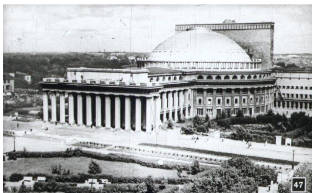
3 рисунок. Новосибирский театр оперы и балета

Мавзолей Ходжи Ахмета Ясави начали возводить по велению Тамерлана в честь известного на Востоке суфийского поэта и проповедника в год победы над ханом Тохтамышем, правителем Золотой Орды.