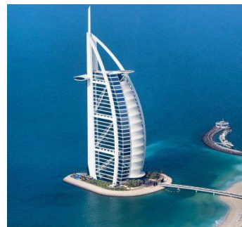
8 рисунок. Бурдж аль араб.

Когда штормовой ветер поднял волны на высоту до четырёх метров из-за сильного ветра было решено по краям острова установить бетонные блоки с отверстиями: вода, ударяясь об них, по инерции огибала остров и возвращалась обратно в залив.