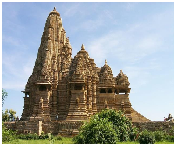
2 рисунок. Храм Кандарья-Махадева