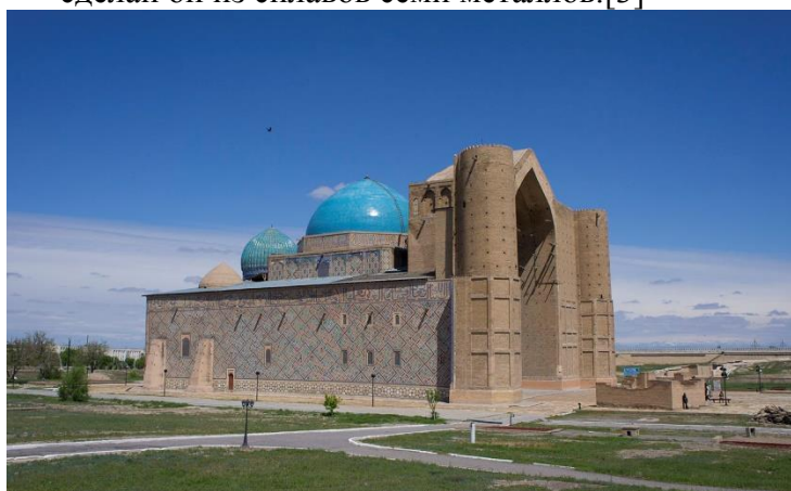
4 рисунок. Мавзолей Ходжа Ахмеда Ясави.

Купол для тюрков был символом единства и гостеприимства. Именно поэтому такое значение было уделено его размеру и внешности. Диаметр купола - 2,45 м., вес 2 тонны, сделан он из сплавов семи металлов. [3]