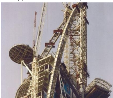
7 рисунок. Бурдж аль араб.

Еще одно весьма удивительное сооружение Бурдж аль араб (Burj al arab), о котором информация будет более подробней. Отель был построен в виде паруса доу, арабского судна. И выбрала я его потому, что для сооружений 21 века это одно из масштабных зданий которая противостоит всем четырем стихиям природы: воздух, огонь, вода, земля. И также подходит по всем критериям для жизни людей в настоящее время.