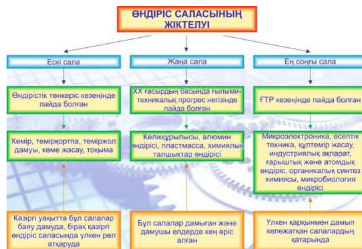
Сурет 3. Өндіріс саласының жіктелуі

Дегенмен, қандай ғажайып технологиялар пайда болғанына қарамастан, ұлттық мәдениеттің дәстүрлі тәсілдерін сақтай отыра, оларды заманауи сұранысқа бейімдей білу осы өнер саласының мамандарының алдына қойылып отырған күрделі талаптардың ең бастысы деп білеміз. Осындай ұлттық мүддені қорғау бағытында біздің елімізде де мемлекеттік деңгейде іске асырылып отырған бағдарламалардың бірі – «Мәдени мұра» болып табылады. Ғылыми ізденіс жасау барысында осы аталмыш бағдарламаны өзіміздің жұмысымызға басты тірек етіп отырмыз.