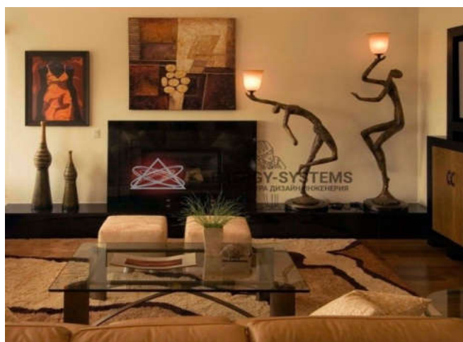
Сур 2 . Интерьердегі этностиль

Дәстүрлі сәулет-көркемдік сипаттағы хабарлар ішкі кеңістіктің құрылымдары мен композицияларының әр түрлі формалары қолданылады, жергілікті материалдан жасалған табиғи кірпіш, тастан, ағаштан жасалған табиғи текстуралар, тән жабдықтар, жарықтандыру және жеке дизайн объектілері қолданылады. Этнодизайн, А. Бровченконың пікірінше, «бұл элементтердің трансформациясы ұлттық мәдениет, атап айтқанда сәндік-қолданбалы өнер (пішіндер, ою-өрнектер, колористика, дәстүрлі техникалар және т.б.) заманауи өнеркәсіптік бұйымдарға енгізу». Сонымен қатар, сәулет кандидаты А. Крыжановский этнодизайн анықтамасына кеңірек анықтама береді. Оның пайымдауынша – «Этнодизайн – бұл кешенді табиғи, техникалық, гуманитарлық білімді, инженерлік ойлауды біріктіретін және жоғары семиотикалық адамның пәндік ортасын қалыптастыруға және өнеркәсіптік жетілдіруге бағытталған пәнаралық жобалау және көркемдік қызмет белгілі бір этникалық дәстүрлердегі тіршілік әрекетінің барлық салаларында мәртебесі бар» [2].