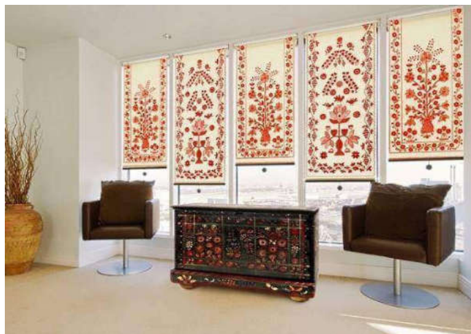
Сур 3 . Якут этностилі

Алайда, барлық осы экзотикалық әсемдікпен оны асырып жіберіп, пәтерді жақын арада шаршайтын мұражайға айналдыру қаупі бар. Сондықтан сіз «Африка астында» стилизацияның жұмсақ нұсқасын тандап, классикалық интерьерді бірнеше заттармен көлеңкелей аласыз. Кофе үстелінде немесе тартпалардың кеудесінде жемістерге арналған тас ыдыс немесе ағаш ваза өте орынды болады; диванға зебра терісіне еліктеп, бұрышқа қара металдан жасалған әсем мүсін қою керек: өркениеттен оқшаулану сезімін қалыптастыру – бұл этностильдің мақсаты.