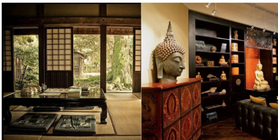
Сур 4. Этнодизайн – қазіргі заманы

Тамақтану – бұл тиісті дизайнды қажет ететін рәсім. Қазіргі якут мәдениеті осы стереотипті сақтау үрдісіне ие, бұл, атап айтқанда, ұлттық тағамдар мейрамханаларының интерьерін безендіруге назар аударудан көрінеді. Интерьердің композициялық және көркемдік тұжырымдамаларын талдау қазіргі мәдениеттің эстетикалық басымдықтары мен тенденцияларын белгілі бір дәрежеде түсінуге мүмкіндік береді. «Осы кезеңдегі проблемалардың бірі-көптеген басқа адамдар сияқты ұлттық брендтерді белсенді түрде жылжытудың болмауы басты себебін қалыптасып қалған этномәдениет болып табылады» – деген пікір бар [4].