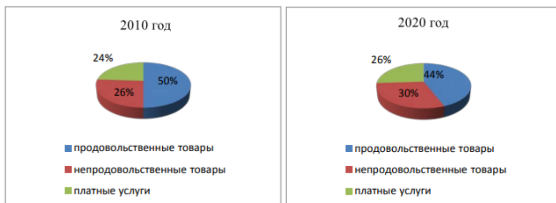
Рисунок 1 – Структура расходов населения в среднем 2010 - 2020 года

Согласно данным на графиках, доля расходов на продовольственные продукты за период 2010–2020 годы снизилась на 6,8%. В свою очередь, величина расходов на непродовольственные товары увеличилась 4,2%. Рост населения с 2010 года на 2020 год составил 14,8%. Также произошел рост номинальных доходов населения на 167%. Увеличение доли непродовольственных товаров закономерно для развивающегося общества. при общем увеличении доходов. Динамика доходов, величины минимального размера пенсии, величины прожиточного минимума представлены на рисунке 2.