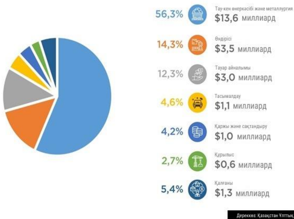
2-сурет. Салалар бойынша Қазақстанға тікелей шетелдік инвестициялар, 2019 жыл

Ұлттық экономиканың кейбір салаларында Қазақстан 2019 жылдың бірінші тоқсанымен салыстырғанда инвестициялық ағындарды ұлғайтты. Мысалы, азық-түлік өндірісіне Инвестициялар 64,6 миллион долларға, отынның көтерме саудасына-20,3 миллион долларға, ал сумен жабдықтау және кәріз жүйелеріне Инвестициялар 16,1 миллион долларға ұлғайды.