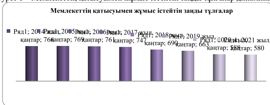
Сурет 1 – Мемлекеттің қатысуымен жұмыс істейтін заңды тұлғалар динамикасы

Ескерту: [6] дерек көзі негізінде құрастырылған.