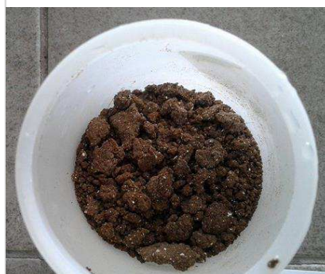
Сурет 1. Алынған ОМТ