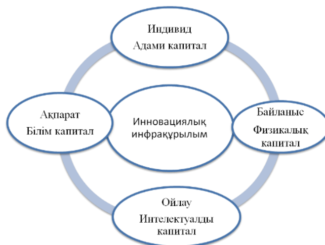
1-сурет. Инновациялық инфрақұрылымды құраушы бөлшектер.

Бүгінгі таңда сәттілікке жету үшін инновацияға арнайы немесе құрылымданбаған тәсілден шығу керек. Ұйымдар тиісті процестерді, әдіснамалар мен қосалқы технологияларды енгізу арқылы инновацияларды мақсатты және мақсатты түрде ынталандыруы керек. Ұйымдар инновацияға жүйелі көзқарасты бір кездері тиімділік пен сапаға жақындағандай қабылдауы және инновациялық инфрақұрылымды орналастыруы керек. (1- сурет).