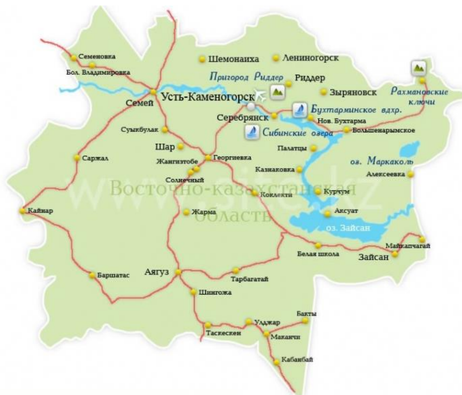
Сурет 1. Шығыс Қазақстан облысының картасы

Өскемен қаласы Қазақстанның солтүстік-шығыс бөлігінде Кенді Алтай тау бөктерінде Үлбі мен Ертіс өзені ағысында орналасқан (сурет 1) [1]. Қаланың жалпы тұрғындары 340,631 мың. адам, соның ішінде қалалық – 328,679, ауылдық – 11,952 адам.