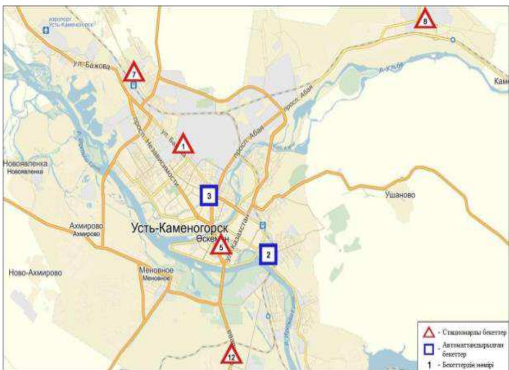
Сурет 4. Өскемен қаласының атмосфералық ауа ластануын бақылау стационарлық желісінің орналасу сызбасы

Атмосфераға шығарылатын заттар тек ауаны емес сонымен қатар топырақ жамылғысын лақтауда. 2018 жылғы көктем мезгілінде Өскемен қаласының түрлі аудандарынан алынған топырақ сынамаларында хром концентрациясы құрамы 0,2-5,1 мг/кг, мырыш – 16,8-509,9 мг/кг, қорғасын – 45,8-632,5 мг/кг және мыс – 2,1-19,0 мг/кг шамасында болды. Түрлі аудандардағы ШЖШ асатын металл шоғырлары: Тракторная көшесі мен Абай даңғылы қиылысында қорғасын шоғыры – 16,2 ШЖШ, мыс – 6,3 ШЖШ, мырыш – 3,2 ШЖШ, кадмий – 19,4 ШЖШ; Рабочая және Бажова («Қазцинк» ЖШС 1 км ары) көшелері қиылысында мыс концентрациясы – 5,3 ШЖШ, мырыш – 22,2 ШЖШ, кадмий – 28,6 ШЖШ, қорғасын – 19,8 ШЖШ; Тәуелсіздік даңғылы автомагистралі ауданында (МАИ ауданы, «Қазцинк» ЖШС 3 км оңтүстік батысқа қарай) кадмий – 8,4 ШЖШ, қорғасын – 8,4 ШЖШ, мыс – 1,8 ШЖШ, мырыш – 1,3 ШЖШ [4];