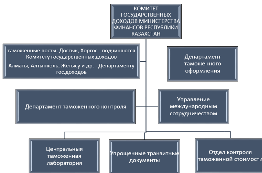
Рисунок 2. Структурное подразделение таможенных органов РК.

государства. Для выполнения качественной работы таможенные лаборатории следуют принципам: деятельность экспертов должна соответствовать современным методам и технологиям; постоянное развитие материально – технической и научно-исследовательской базы; увеличение областей аккредитации. На рисунке 2 показано структурное подразделение таможенных органов РК.