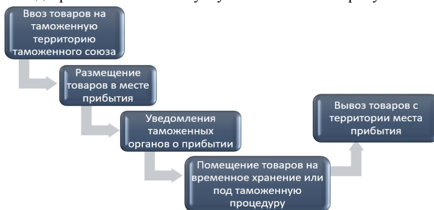
Рисунок 1 Основные виды работ таможенных услуг РК

Основные виды работ таможенных услуг РК показаны на рисунке 1.