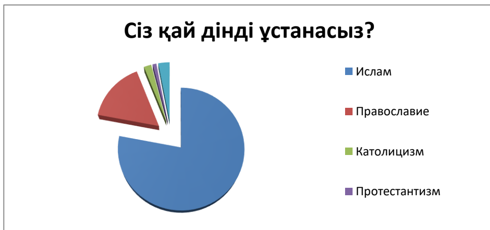
№ 2 Кесте «Сіз қандай дінді ұстанасыз?»

индустриалдық қоғамнан жаһандану барысындағы бүкіләлемдік постиндустриалды дәуірге дейін ұластырушы болды. Жалпы, ХХІ ғасырдың басы Қазақстан үшін азаматтық қоғам мен мемлекеттік билік арасында діни мәселелердің жалпы портретін бағалауға қатысты нақты үйлесімдіктің жетіспеуімен сипатталады. Бірінші кезең салыстырмалы түрде позитивтік акциентпен сипатталса, ал екіншісінде мемлекеттің ар-ождан мәселесіндегі жалпы бағыттарына қатысты сенімсіздіктер мен күмәндар әлсін-әлсін айқын айтыла бастады. Ірі, дәстүрлі конфессиялар белгілі бір деңгейде ұжымдық идеология ретінде қарастырылады. Бұл тұрғыдан дәстүрлі діни бірлестіктердің атқарар рөлі орасаң зор. Төменде ҚР БҒМ 2014 жылы «Қазақстандағы діни жағдай және жастардың діни сана-сезімін жандандыру процестері» әлеуметтік зерттеу жобасына сәйкес жасалған аналитикалық есеп ұсынылады [3].