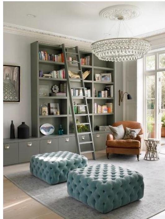
Рис. 3 - Интерьер по формуле 60:30:10+Ч

В приведенных примерах сразу видны основные, дополнительные и акцентные цвета, которые создают живую и своеобразную атмосферу.