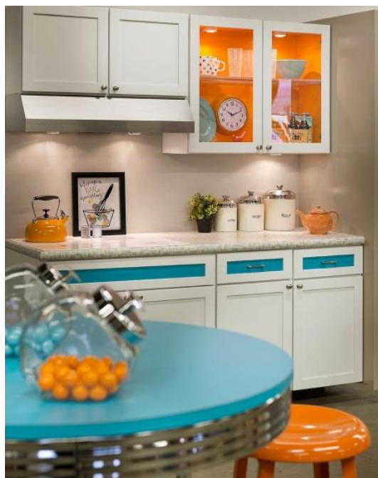
Рис. 7 – Предельно удаленная цветовая гамма

В данном примере контраст выглядит слишком ярким и подойдет не каждому. Для смягчения этого сочетания лучше использовать не противоположные, а соседние цвета справа или слева. Примеры сочетаний: красный и желто-зеленый, синий и красно-оранжевый и тд. Такое сочетание называют предельно удаленным (рис. 7).