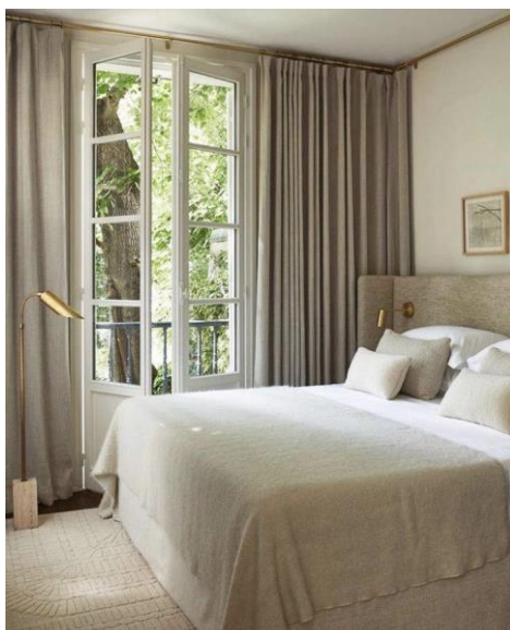
Рис. 5 – Монохромная гамма цветов в спальне

Теперь поговорим о спальне. Как и в гостиной комнате, здесь тоже не следует экспериментировать с контрастом цветов. В спальне лучше использовать монохромную гамму цветов (рис. 5). Совет Коко о подборе наряда – «Перед тем как выйти из дома, посмотрите в зеркало и снимите что-нибудь одно» - полностью применим к пастельной гамме. Стиль «чем меньше, тем лучше» идеален для спальни [4].