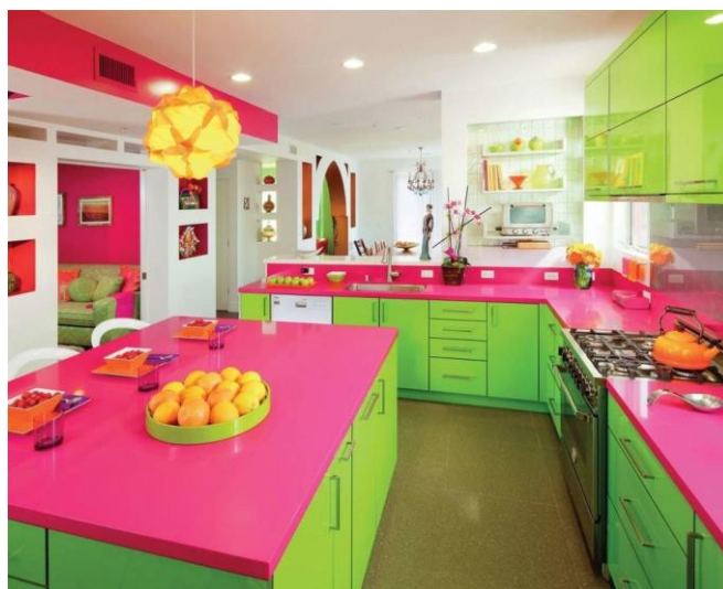
Рис. 6 – Кухня в контрастных цветах

Рассмотрим кухню выполненную в контрастных цветах (рис. 6).