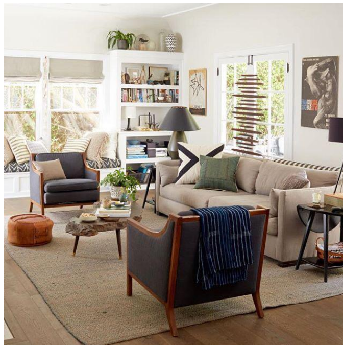
Рис. 4 – гостиная комната в нейтральных тонах

Гостиная комната – это пространство – визитная карточка вашего дома, сделайте его запоминающимся. Но не стоит экспериментировать с контрастом цветов в этом помещении. При частом прибытии в этой комнате вам это может надоесть. В гостиной комнате лучше создать спокойную, расслабляющую атмосферу (рис. 4).