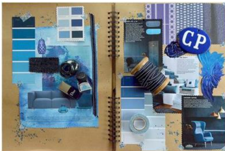
Рис. 1 - Цветовая гамма в интерьере

Для начала разберем понятие «цветовое решение». Цветовое решение – это не только выбор цвета стен или потолка, это подбор цветовой гаммы для всего дома начиная от мебели и стен, а заканчивая элементами декора (рис. 1). Полученная цветовая гамма создает свою особую атмосферу и определенный стиль [1].