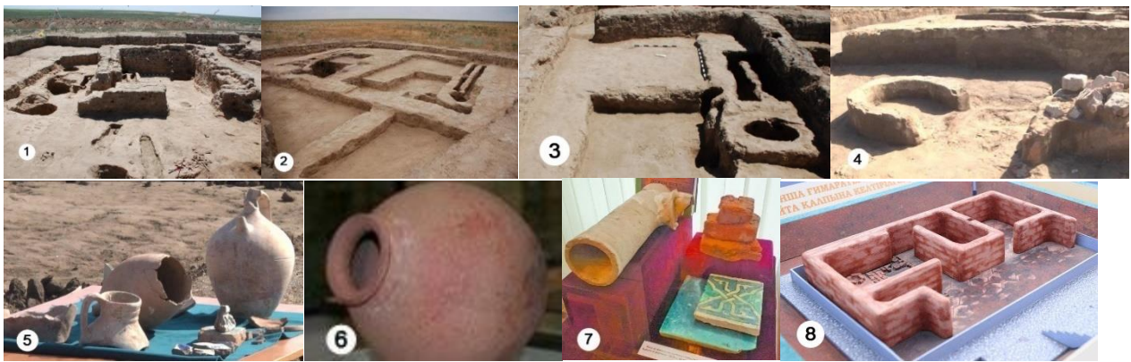
1 сурет – Жайық қалашығының орнынан табылған артефактлер: 1-4 – тұрғын үйлердің қалдықтары; 5,6 – қыш ыдыстар мен хумдар; 7 – санитарлық қыш құбыр, күйдірілген кірпіш және, оюландырған, түсті қыш тақташылар; 8 – археологиялық зерттеудің негізінде жасалған үй моделінің фрагменті (музей экспонаты).

Сырдарья атрабының көне қалалары (Отырар, Сауран, Түркістан, Көк Мардан, Созақ және т.б.) тұрғын үйлерінің зерттелген нәтижелеріндегі оларға тән дәстүрлік ортақ сипаттарын келтіреміз [2-4].