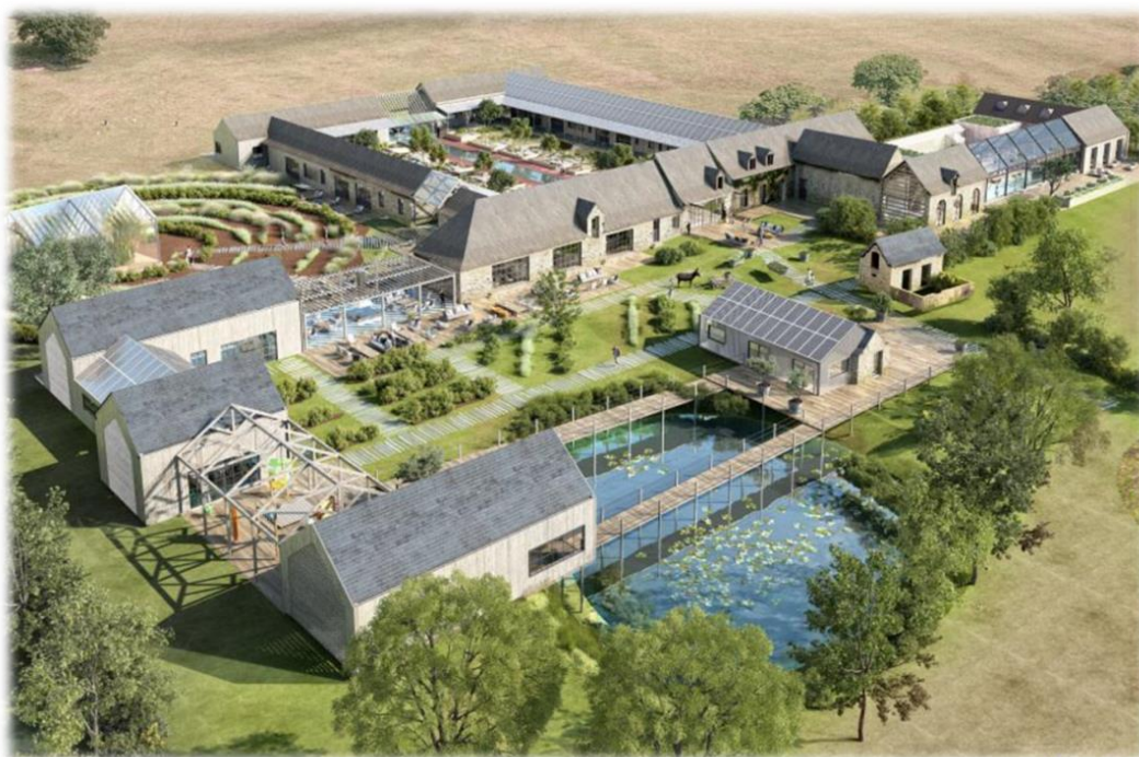
Рисунок 2. Пример архитектуры агрокомплекса

Помимо специализированных сельскохозяйственных фермерских хозяйств, для работников реализован проект коттеджных домов эконом-класса для постоянного проживания, а туристы могут расположиться в экологически чистых, теплых, энергосберегающих домах с разведенными внутри инженерными коммуникациями ( рисунок 2) [2].