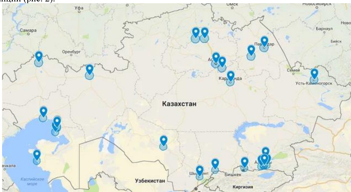
Рис. 2. Схема расположения базовых референсных станций «LeicaGeoSystems»

В составе компании ТОО «LeicaGeosystemsKazakhstan» находятся 28 референсных станций (рис. 2).