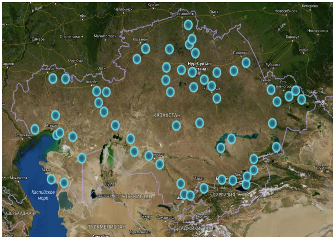
Рис. 3.Схема расположения базовых референчных станций «Қазақстан Ғарыш Сапары»

высокоточной спутниковой навигации Республики Казахстан (СВНС РК), владеет на территории Казахстана 60 навигационными станциями приема спутниковых сигналов GPS/ГЛОНАСС с выдачей корректирующей информации потребителям с метровой и сантиметровой точностями в режиме реального времени (рис. 3)