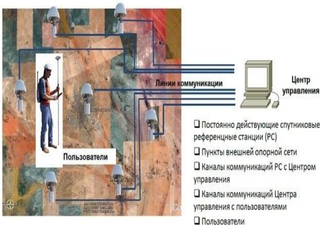
Рис.6. Структура региональной референчной GNSS-сети

В последнее десятилетие сети постоянно действующих базовых (референчных) станций все чаще находят применение для высокоточного определения координат стационарных объектов при решении кадастровых, землеустроительных и инженерно-геодезических работ, для мониторинга деформаций зданий и сооружений, вызванных природными и техногенными явлениями, а также для обеспечения безопасности различных видов транспорта (рис. 6). Если для определения местоположения стационарных объектов порой необходимо знать координаты вплоть до миллиметров, то в интересах безопасности транспорта можно обойтись меньшей точностью: от нескольких метров до нескольких дециметров в зависимости от вида транспорта и эволюции его движения.