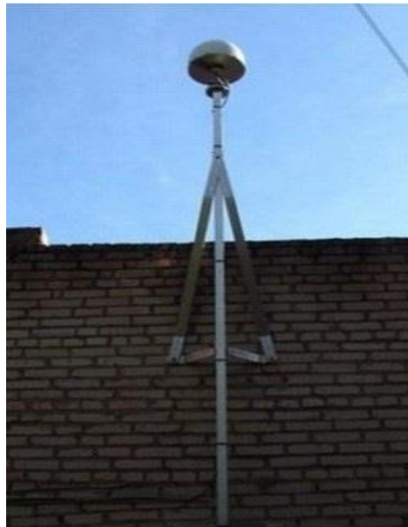
Рис. 1. Базовая референсная станция «LeicaGeosystems»

В составе компании ТОО «LeicaGeosystemsKazakhstan» находятся 28 референсных станций (рис. 2).