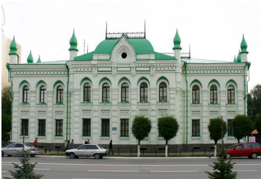
Рисунок 4. Областной историко-краеведческий музей, 1836 г.

На рисунке 3 Храм Христа Спасителя, 1891 г. На освящении храма присутствовал царевич, будущий император Николай II. Храм построен в Новомосковском стиле, является памятником архитектуры. На рисунке 4 областной историко-краеведческий музей, 1836 г. Самые древние находки, хранящиеся в музее, датируются приблизительно IV - V веками до нашей эры.