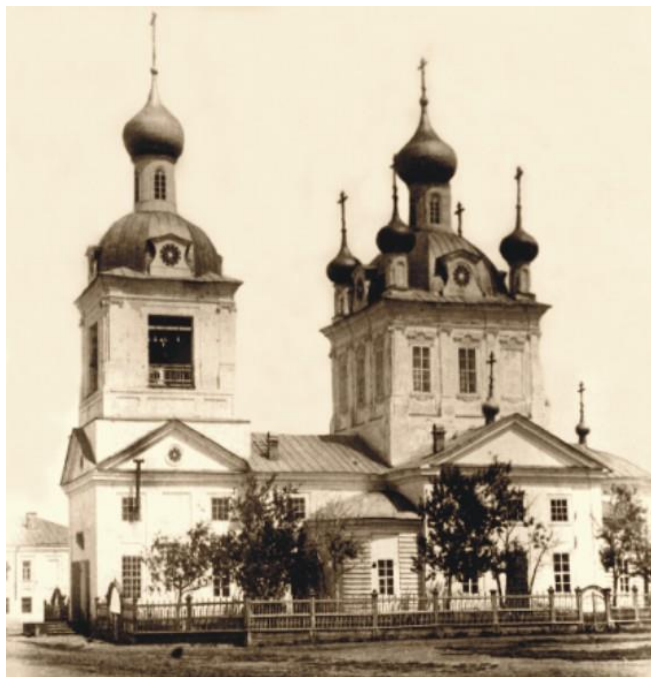
Рисунок 1. Петропавловский собор на месте Петропавловской церкви

До гражданской войны в городе было 15 единоверческих и православных приходских и соборных церквей (в пригороде ещё 4), 4 домовых храма, 4 мечети, несколько молитвенных домов, театр, музей, несколько больниц и библиотек, женская и мужская классические гимназии, реальное училище, учительская семинария, множество школ, выходило несколько газет.