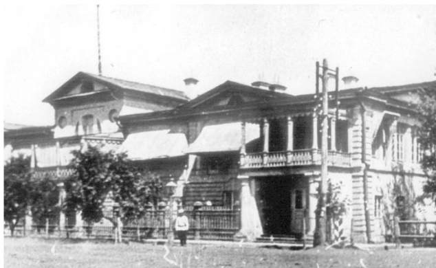
Рисунок 2. Дом-музей Е. Пугачева и Резиденция наказного атамана

До начала XX века Уральск являлся административным центром Уральской области, столицей Уральского казачьего войска, был частью Оренбургской губернии.