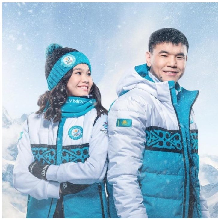
2- сурет. Қазақстан ұлттық құрамасының олимпиадаға арналған формасы

Алайда, сондай жағдайдың өзінде ара-кідік болса да, анда-санда бір жарқ етіп, заман талабына сай күнделікті киетін киімдерімізде, аяқ киімдерімізде, тұрмыстық заттарда, зергерлік бұйымдарда, архитектуралық ғимараттарда әсіресе графикалық дизайн саласында қолданылып қалатын сирек көріністер, әлем халқын еріксіз мойын бұрғызатын әсер әкелуде. Бұл сөзімізге соңғы Токио мен Бейжінде болған олимпиадаға арнап тігілген спорттық киіміміз дәлел болады. Жазғы және қысқы олимпиадаға арнап тігілген Қазақстан ұлттық құрамасының формасы, ең әдемі формалардың қатарынан көрінді (2-сурет) .