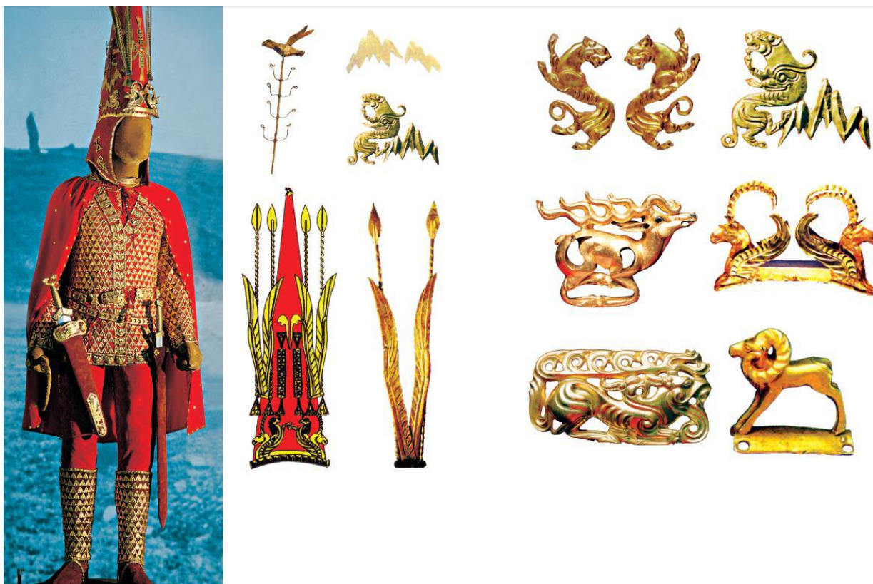
1- сурет. Алтын адам және онда бейнеленген өрнектер

Күндегі киілетін киімдерден бастап, тұтынатын тұрмыстық заттар, ыдыс-аяқ, ертұрман, әуездік аспаптармен қатар, тіпті, сауыт-сайман, қару-жарақтарға дейін оюмен әшекейленген. Архитектура мен зергерлік бұйымда қолдану орны мүлде бөлек. Ғұн мәдениетінде сыртқы пішіні пирамидаға ұқсап жасалынған «үшбұрыш» өрнегі әйелдерінің алкасында пішінделді. Ғұндар өнерінде киізге, былғарыға, тастарға түрлі пішіндер таңбалады. Зергерлік бұйымдарға үй жануарлары мен аңдардың суреттерін түсірді. Сақ тайпасының жалғасы болып табылатын үйсіндер мен қаңлылардың мәдениеті сақ мәдениетін одан ары қарай дамытты. Оларда темірден жасалған өрнектер көптеп кездеседі. Үйсіндер мен қаңлыларда бейнеленген ою-өрнектердің басым бөлігі геометриялық элементтерден тұратын еді. Түрік қағанаты өмір сүрген жәдігерлерге сүйенсек, колөнер шеберлері үстем тап өкілдеріне арнап үй-жиһаздарын, ертұрман, киім-кешек, ыдыс-аяқ, зергерлік бұйымдарына геометриялық және өсімдік сипатты ою-өрнектерді салып отырды. Бұл сөзіміздің дәлелі сақ мәдениетіне жататын әлемде ешқандай теңдесі жоқ «алтын адам» киімдеріндегі қолданған ою-өрнектер (1-сурет).