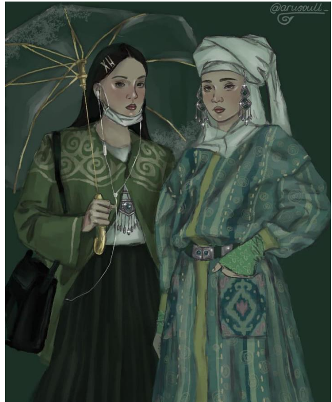
3- сурет. Ұлттық ою-өрнектердің заман талабына сай бейнедегі көрінісі.

Оюдың әрқайсысы белгілі бір ұғымға немесе қандай да бір жағдайға байланысты өрнектелетіні түсінікті. Соны ескерсек, ою-өрнектердің айтар ойы мен берер тәрбиесі де мол. Осы орайда айта кетерлігі, қазақ халқы әр оюға ерекше мән беріп, оның қайда, қандай бұйымда немесе қандай киім үлгісінде қалай қолданылуы керектігіне көп көңіл бөліп, ешқандай қателіктің кетпеуін жіті қадағалаған. Өйткені оюлар атауларына, көлеміне, пішініне, түр-түсіне қарай өзіндік мағына ие. Балаларға арналған оюлар, ерлер мен әйелдерге тән оюлар бар. Қыз балалардың бешпетіне, көйлегіне гүл тәрізді немесе қанатты қарлығаш секілді өрнектерді бейнелеген. Ер баланың киіміне найзаның ұшы, бүркіт, қошқар мүйіз секілді өрнектерді батыр, алғыр болсын деген ырыммен салған.