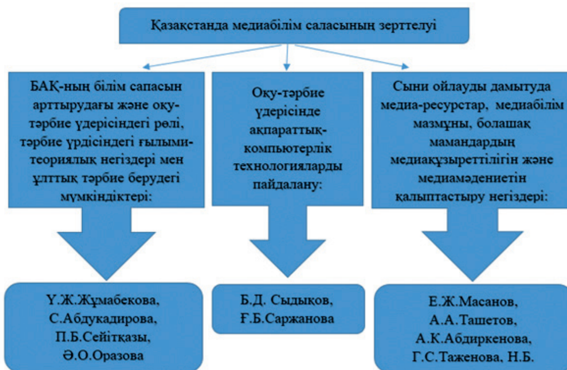
Сурет 2. Қазақстанда медиабілім беру саласының зерттелуіне үлес қосқан ғалымдар

Төмендегі суретте БАҚ-ның оқу-тәрбие үдерісіндегі рөлі, медиабілім, медиамәдениет, медиақұзыреттілікті зерттеуге және дамытуға үлес қосқан отандық ғалымдардың негізгі жұмыс бағыттары көрсетілген. (Сурет 1):