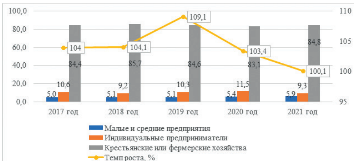
Рисунок 1 – Структура количества субъектов МСП в сельском хозяйстве, % Примечание – Составлено авторами на основе источника [10]

Целевая ориентация государственной политики на прирост субъектов малого и среднего предпринимательства (в целом по всем отраслям рост составил около 25%), в том числе в сельскохозяйственной отрасли, увеличение потребностей продовольственного рынка, его объема и структуры оказали существенное влияние на положительную динамику развития МСП в данном секторе экономики, обеспечив рост количества с 222,2 тысяч единиц до 261,1 тысяч единиц или 17,5% (в среднем за период темп роста составил 4,1%) (рисунок 1).