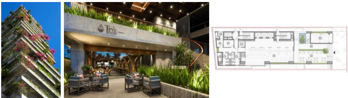
Рисунок 1. а) Общий вид. б) Интерьер. в) План 1-го этажа.

Архитектура современных отелей предельно функциональна и современна, использует новейшие достижения строительных технологий, современные конструкции и строительные материалы. Новейшее инженерное оборудование – системы «энерго» и водоснабжения, вентиляции и обогрева позволяют создавать внутри гостиничного комплекса свой микроклимат, комфортную для человека среду. Обладая автономностью, такие комплексы дают возможность человеку реализовать свои потребности в развлечениях и отдыхе, не выходя за его пределы. Кроме этого, в подобных отелях созданы все условия для успешного проведения различных бизнес – мероприятий, съездов, конференций и т.д. Например, отель Chicland Danang (Рис.1), расположенный в городе Дананг, Вьетнам, построенный по проекту VTN Architects в 2019 году. Отель спроектирован для бизнес-встреч, соответственно располагает всеми необходимыми помещениями, такими как: конференц-зал, банкетный-зал, лаундж-бар, террасу на крыше и т.д. Вертикальные бетонные фасады здания, высотой 72 метра, покрыты тропической системой озеленения, которая интегрирована в балконы номеров. Эта система озеленения имеет простую конструкцию и проста в эксплуатации.