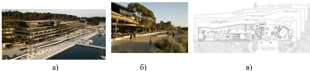
Рисунок 4. а) Общий вид. б) Организация территории. в) План 1-го этажа.

Каскадные типы зданий отелей чаще строят в курортных местностях, где плоские выступы крыш нижележащих этажей могут быть целесообразно использованы для организации открытых, иногда озелененных террас, соляриев и т.д. Нередко каскадные композиции применяются при размещении гостиниц поперек рельефа. Примером может послужить гостиница Grand Park Hotel Rovinj, которая находится в городе Ровинь, Хорватия. Гостиница располагает оздоровительным спа-центром, ресторанами, конференц-залами, бутиками, открытым бассейном и собственной пристанью для яхт. Во всех номерах есть балкон и терраса для отдыха, благодаря которым и сложилась интересная форма здания.