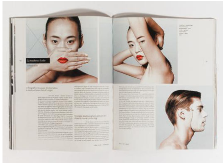
Сур. 3 - Jekyll & Hyde дизайнерлері Must журналына