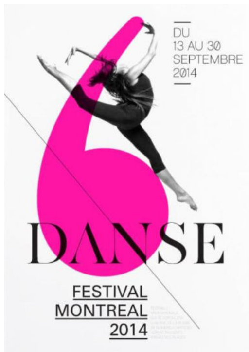
Сур. 4 - Тиболт Джулианның жұмысы

Келтірілген мысалда Тиболт Джулиан негізгі ақпаратқа назар аудару үшін жоғары контрасты түстерді пайдаланады. Сонымен қатар, 4-суретте мысал ретінде көрсетілген қнімнен байқауға болатын жағдай, оның жеңіл және жұқа қаріптерді қолданғандығы және солардың көмегімен басқа элементтердің қайталанып орналасқандығын байқауға болады.