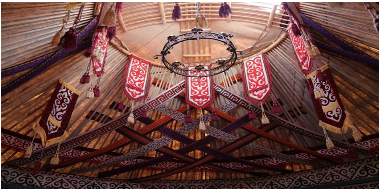
Рисунок 2 Шанырак

Этнический колорит будет полностью соблюден, если в интерьере использовать войлочные картины с изображением сцен из мифов, обереги из зубов и костей диких животных, рога и чучела животных и птиц. Органично в декор впишутся национальные инструменты музыкантов – кобыз и домбра.