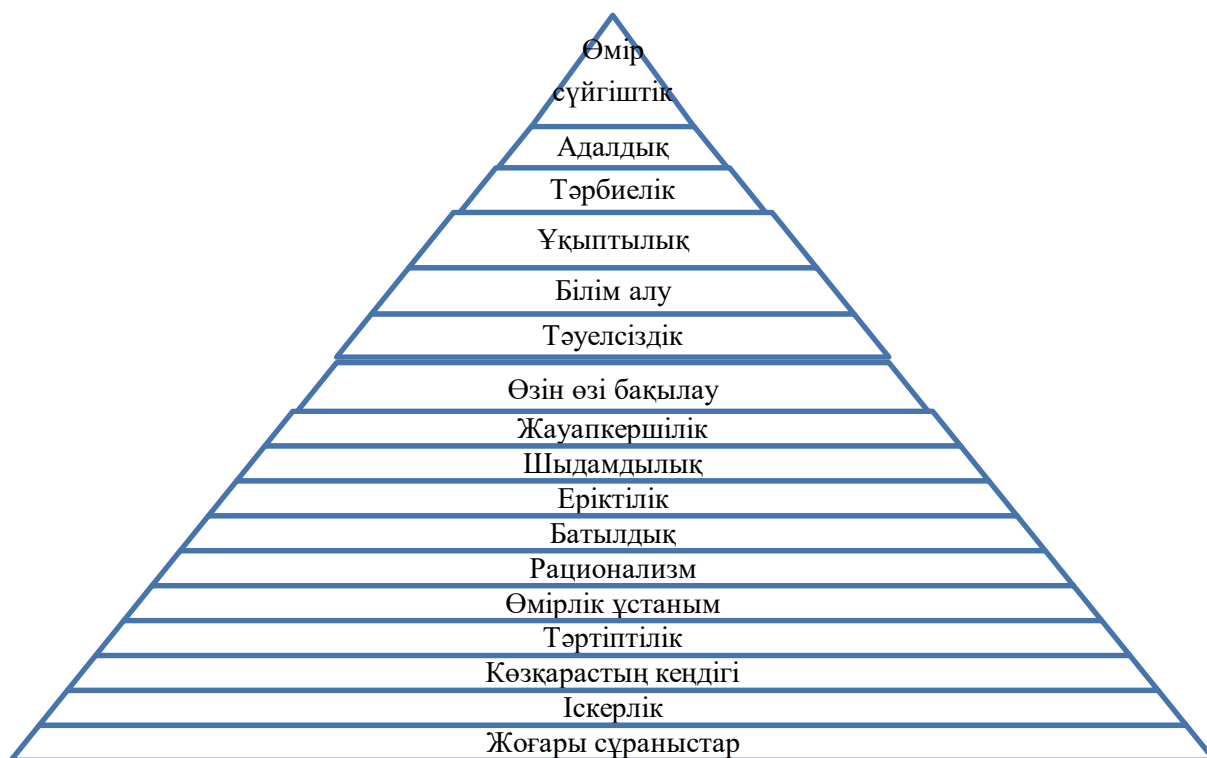
Сурет 1. Инструменталды құндылықтар бойынша 8 сынып оқушыларының диагностика нәтижесі

8 сынып оқушыларының диагностика нәтижесі бойынша 13-14 жас аралығындағы жасөспірімдердің қажеттіліктерінің басым көпшілігі бақытты отбасылық өмір, денсаулық, адалдық, тәрбиелік, білім алу, сенімді достарды бағалайтыны байқалды (Сурет 2).