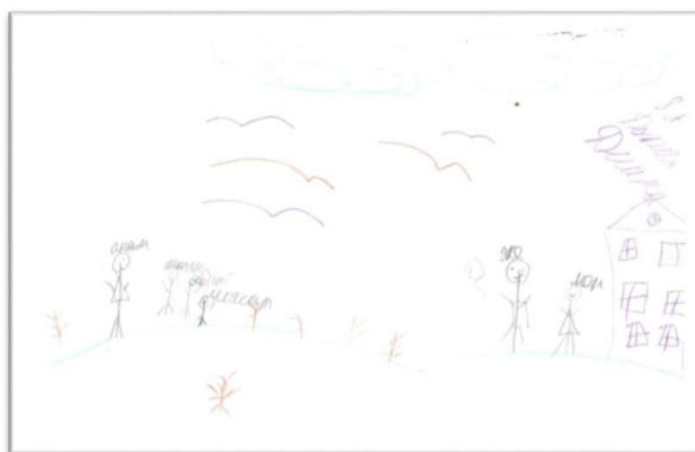
Сурет 5. Оқушы А отбасын бейнелеген суреті

Зерттелуші Д денсаулықты ең жоғарғы құндылыққа бағалағанымен, отбасын материалды құндылық пен қызықты жұмыстан соң белгілейді.