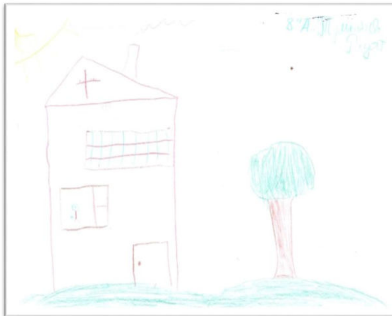
Сурет 4. «Д» есімді баланың отбасы суреті

Бұл суретте адам тұрмайтын, көп бос терезелер саны бар, үлкен үй бейнеленген. Суреттегі Күн қорғау мен жылылықтың символы. Отбасы мүшелері салынбаған.