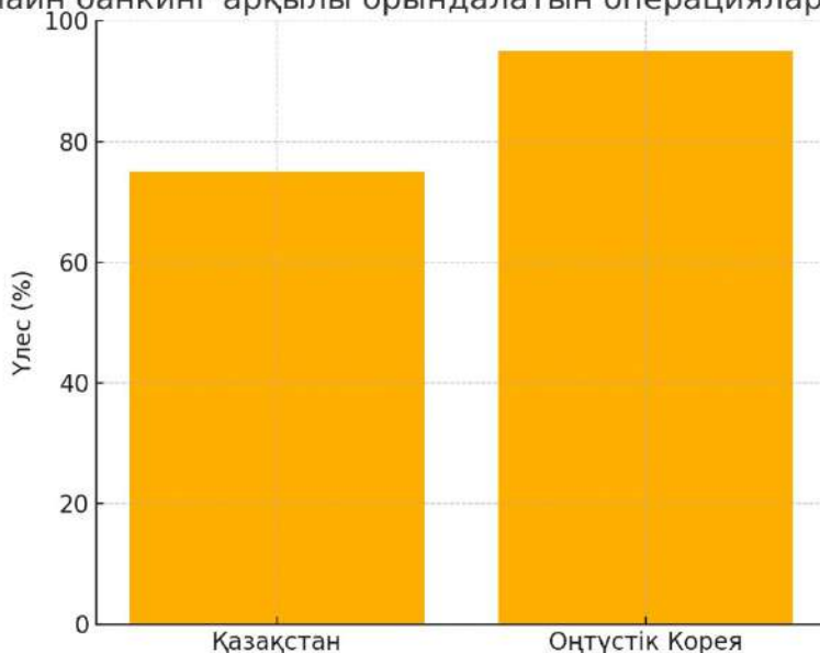
2-сурет – Онлайн банкинг арқылы орындалатын операциялар үлесі (%) Ескерту: [9; 10] деректері негізінде автор құрастырған

Қазақстанда мобильді қосымшалар, атап айтқанда Kaspi.kz және Halyk Homebank, цифрлық сервистерді едәуір танымал еткен. Алайда бұл шешімдер негізінен жеке банк экожүйелері аясында жұмыс істейді. Оңтүстік Кореяда болса, банк қосымшаларына қоса, ұлттық деңгейдегі біріңғай цифрлық сәйкестендіру жүйесі (Digital ID), төлем платформалары (мысалы, Naver Pay, Samsung Pay) және ашық API стандарттары кеңінен қолданылуда.