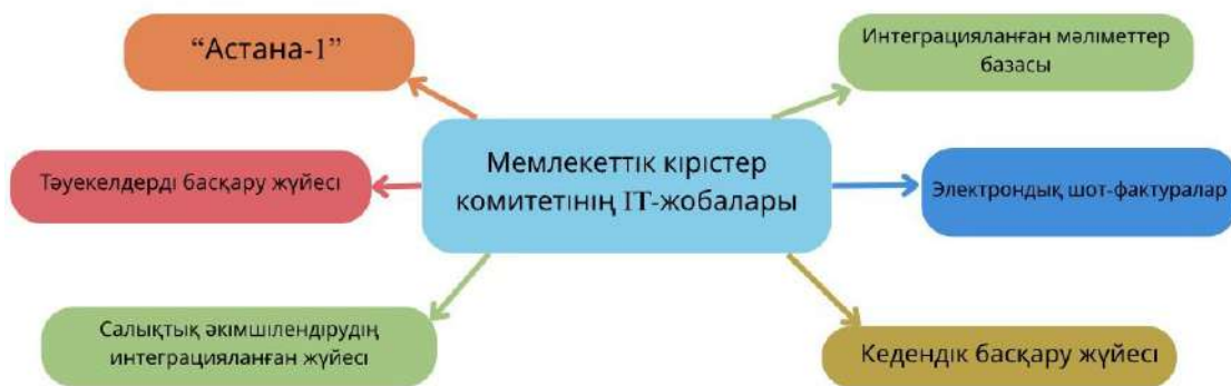
Сурет 1 – Мемлекеттік кірістер комитетінің салықтық әкімшілендіру саласындағы жобалары