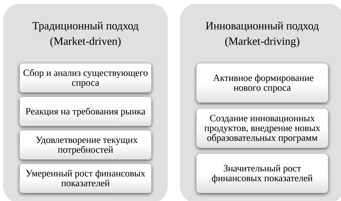
Рисунок 2. Сравнительная схема традиционного и инновационного подходов Примечание – составлено автором на основании источника [3]

Эта схема демонстрирует, как за счёт внедрения инновационных образовательных продуктов, активного использования социальных сетей и цифровых платформ, вуз способен стимулировать появление нового спроса и повышать конкурентоспособность на региональном и международном рынках образовательных услуг.