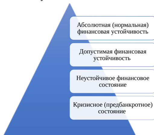
Рисунок 1 – Классификация финансовой устойчивости строительных компаний Примечание – составлено автором на основе источников [2]

Финансовая устойчивость строительных компаний определяется их способностью эффективно управлять активами, сохранять ликвидность и обеспечивать стабильное финансирование проектов. Однако степень устойчивости может варьироваться в зависимости от структуры капитала, уровня долговой нагрузки и способности адаптироваться к изменяющимся условиям рынка. Для более детального анализа различают несколько уровней финансовой устойчивости.