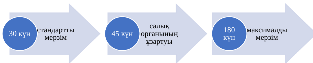
Сурет 1 – Салықтық тексерулер жүргізу мерзімдері Ескерту - ҚР СК дереккөз негізінде құрастырылған.

Салық төлеуші тексерудің басталғаны туралы ол басталғанға дейін кемінде 30 күн бұрын хабардар етілуге тиіс. Хабарламада тексеру түрі, тексерілетін мәселелер тізбесі, ұсынылуы тиіс құжаттардың тізімі көрсетіледі. Салық төлеушіге алдын ала ескертусіз жүргізілетін жоспардан тыс тексерулер ерекшелік болып табылады.