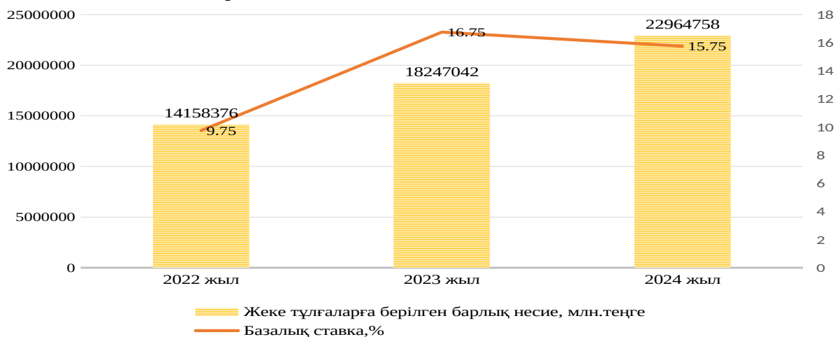
Сурет 1 – Жеке тұлғаларға берілген несие көлемі мен базальдық мөлшерлеме деңгейі Ескерту – [2],[3] дерек көзі негізінде автормен құрастырылды.

Тұрғындардың бұрыннан алған несиелерінің көлемі мен олардың төлем қабілеттілігі арасындағы тепе-теңдік те маңызды рөл атқарады. Егер халықтың борыштық жүктемесі жоғары болса, жаңа несиелерді өтеу қиынға соғады, ал несиелік дефолттар көбеюі мүмкін. Сонымен қатар, тұтынушылық мінез-құлықтың өзгеруі, мысалы, қарыз алушылардың сақтық танытып, несие алудан бас тартуы немесе керісінше, артық несие алу үрдісі несие нарығының тұрақтылығына әсер етеді. 1-суретте жеке тұлғаларға берілген несие көлемі мен базалық ставка деңгейі көрсетілген.