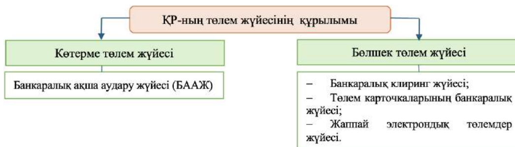
Сурет 1 – Қазақстан Республикасының төлем жүйесі құрылымы Ескерту – [1, 114 б.] дереккөзі негізінде автормен жасалған

Көтерме төлем жүйесі (банкаралық ақша аудару жүйесі, БААЖ) – үлкен сомадағы төлемдерді жылдам әрі нақты уақыт режимінде өңдейтін жүйе. Бұл жүйе қаржылық ұйымдар мен мемлекет арасында үлкен сомада ақша аударымдарын жылдам жүзеге асыруға мүмкіндік береді. RTGS арқылы әр транзакция жеке өңделіп, кері қайтарылмайды [3].