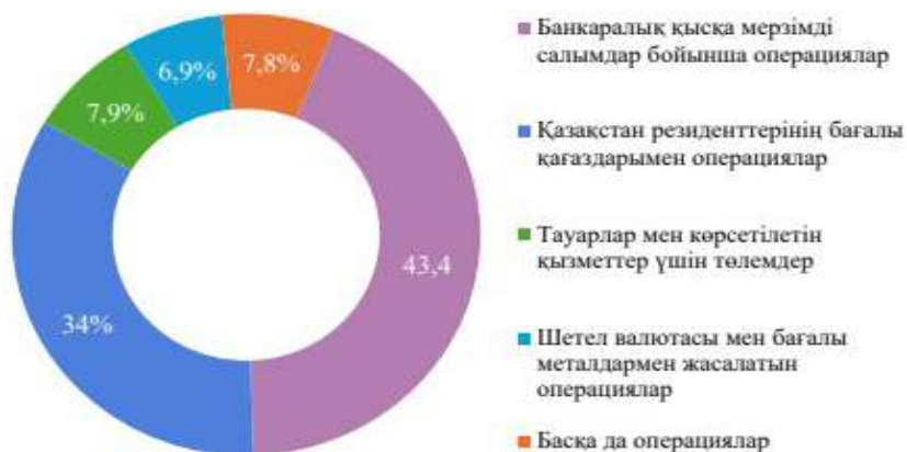
Сурет 5 – ҚР-ның 2024 жыл бойынша банкаралық ақша аударымдары жүйесінің (БААЖ) құрылымы

теңгені құрады. 2023 жылмен салыстырғанда орташа бір күндік төлем сомасы 1,9 трлн теңгеге (49,8%-ға), төлем саны 19 мың бірлікке (18,2%-ға) артқан. БААЖ динамикасының тұрақты түрде өсуін, банкаралық ақша аудару жүйесі арқылы ірі сомадағы төлемдерді (мемлекеттік, корпоративтік және т.б.) жүргізудегі банктік клиенттердің сенімділігінің артқанын айқындайды. БААЖ арқылы жүргізілетін төлем операциялар құрылымы оның белсенділік деңгейін анықтайды. 2024 жылғы деректерге сүйене отырып, (БААЖ) бойынша ақша аударымдарының құрылымы қаржы нарығының дамуымен, инвестиция көлемімен және сыртқы сауда белсенділігімен тығыз байланысты екенін көруге болады (Сурет 5).