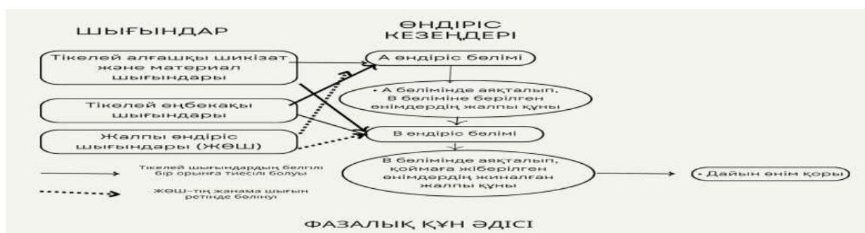
Сызба 1. Фазалық есептік басқару әдісінің моделі

Кезеңді калькуляциялау әдісінде шығындар өндірістің әрбір сатысында жинақталады және бірліктің өзіндік құнын есептеу үшін осы кезеңде өндірілген өнім санына бөлінеді. Бір кезеңде аяқталған өнімдер осы кезеңде жұмсалған жалпы шығындармен бірге келесі кезеңге ауыстырылады. Осылайша, әрбір өндіріс кезеңінің жиынтық құны анықталады. Бұл әдістің артықшылығы - өндіріс процесінің әрбір кезеңінде шығындарды бақылауға және талдауға мүмкіндік береді. Сонымен қатар, ол үздіксіз өндіретін және тоқтатыла алмайтын кәсіпорындарда шығындарды есептеуді жеңілдетеді.