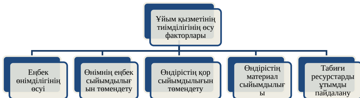
Сурет 1 – Қызмет тиімділігінің өсу факторлары (шығындар түрлері бойынша) Ескерту – автормен [2, б. 87-91] негізінде құрастырылған

Ұйымның экономикалық тиімділігін арттырудың негізгі факторлары өндірісті дамыту және жетілдіру бағыттарына байланысты 2-суретте көрсетілген.