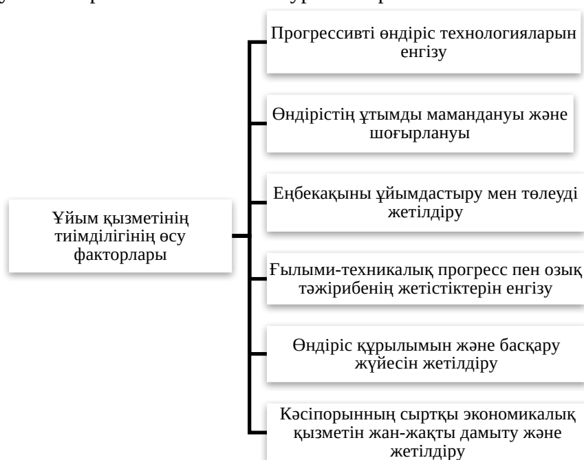
Сурет 2 - Қызмет тиімділігінің өсу факторлары (өндірісті дамыту және жетілдіру бағыттары бойынша)

Ұйымның экономикалық тиімділігін арттырудың негізгі факторлары өндірісті дамыту және жетілдіру бағыттарына байланысты 2-суретте көрсетілген.