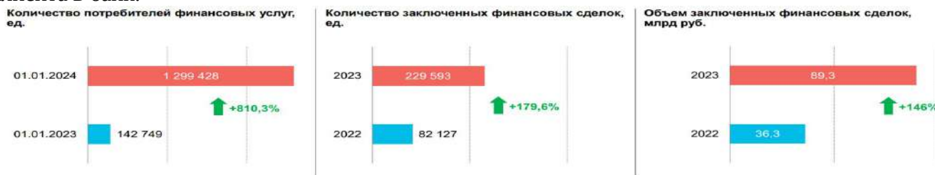
Рисунок 3 – Показатели использования цифровых платформ для совершения финансовых сделок [1]

Доля счетов физических лиц, доступ к которым предоставлен дистанционным способом и по которым с начала года проводились операции по списанию денежных средств, в общем количестве счетов физических лиц, которые могли быть использованы для проведения платежей, составила 32,6%. Увеличилось до 139 (+5,3%) количество действующих КО, которые оказывают услугу по открытию банковских счетов без явки клиента в банк.