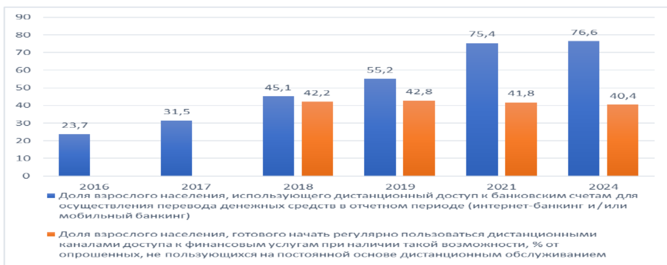
Рисунок 1 – Данные по доступности финансовых услуг в цифровом формате

На рисунке 1 представлены данные по уровню проникновения услуг среди взрослого населения.